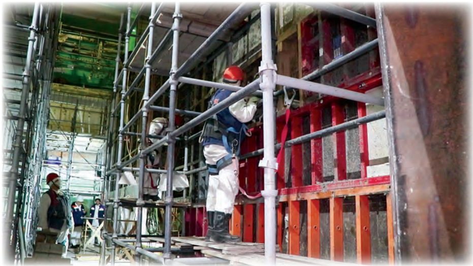
▲ На радиохимическом заводе идёт монтаж электропечи для остекловывания радиоактивных отходов

Сегодня на радиохимическом заводе активно идёт монтаж шестой по счёту электропечи для остекловывания радиоактивных отходов – ЭП 250/6.