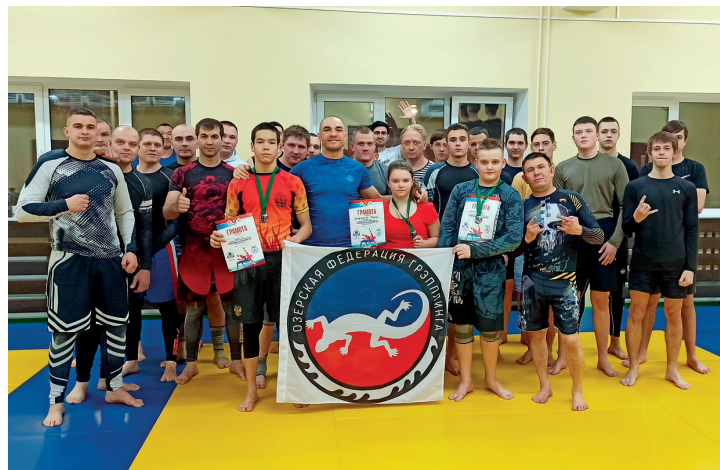
▲ Копилка озерского клуба единоборств пополнилась новыми наградами

Марина ЮРЬЕВА