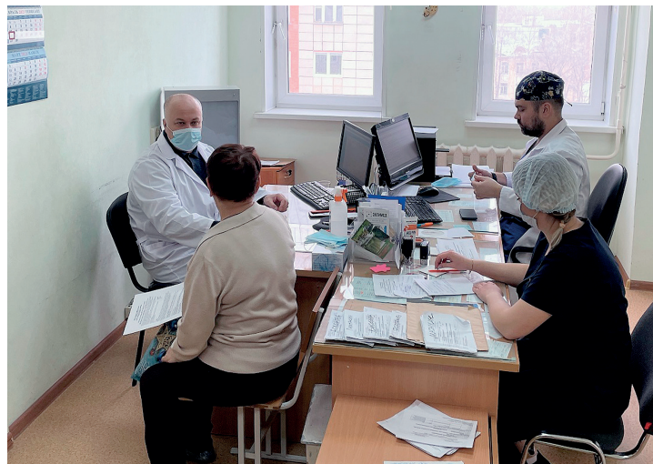
▲ Специалисты ФМБА осмотрели и проконсуль- тировали 77 озерчан

Озёрский городской округ посетила команда из лучших врачей ФМБА России.