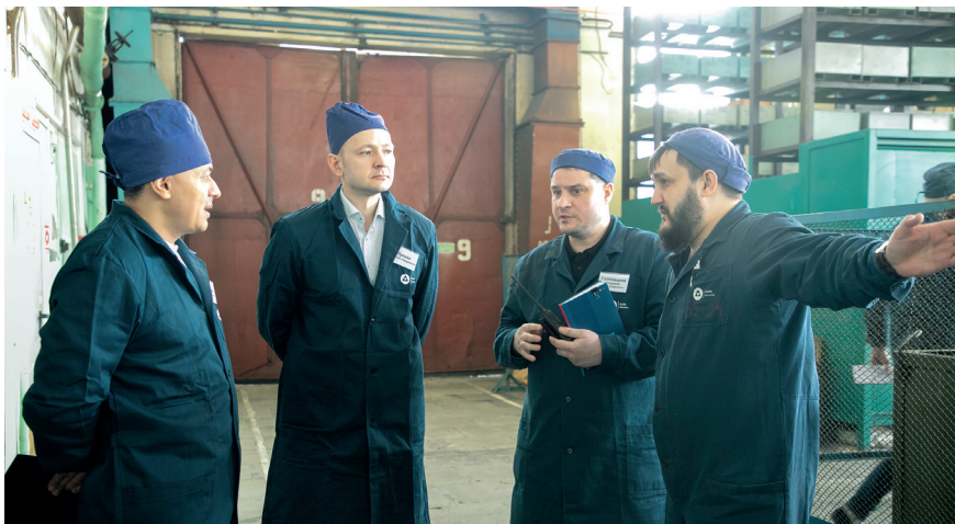
▲ Вместе с работниками подразделения участники Совета обсудили вопросы безопасной деятельности на производстве

Новшество в работе Совета по КБП – чек-лист для обработки информации, полученной от работников подразделений «Маяка» в ходе очередного выездного заседания. В чек-листе фиксируются удачные и неудачные действия персонала, а также нарушения, которые могут привести к критическим последствиям. Вместе с работниками участники Совета по КБП на месте прове-