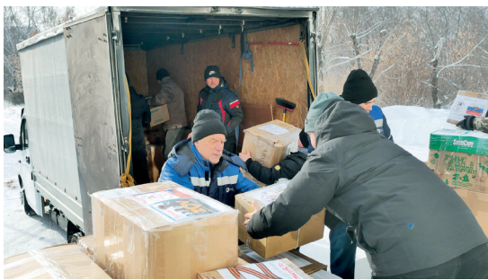
▲ С погрузкой собранных вещей помогли работники ПО «Маяк»

Объединение «Шьём для наших ZVO_Озерск» возникло спонтанно на основе желания помочь бойцам, участвующим в СВО на Донбассе. Из пары активисток оно стало целым движением, которое организует отправку теплых вещей, медикаментов, постельного белья для госпиталей и многого другого.