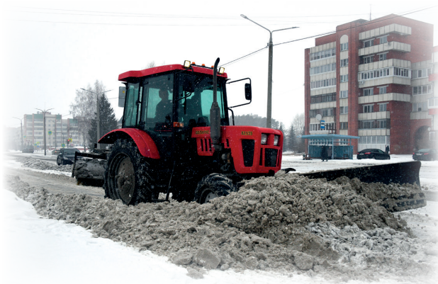
▲ Уборка снега на автобусной остановке на Семенова, 2

– На уборку были выведены 14 единиц снегоуборочной техники, – отметила начальник управления капитального строительства и благоустройства администрации округа Надежда Белякова. – Работы прошли в Заозер-