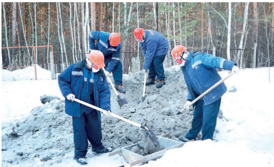
▲ На «Мирном атоме» отряды «Барс» и «Танкоград» были не единожды

Все без исключения стройотряды зимнего «Мирного атома-2023», завершив серию обязательных инструктажей, заступили на свои рабочие места.