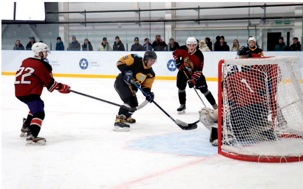
▲ Опасный момент у ворот ХК «Коркино»

Интернет – великая вещь. Можно не выходя из дома онлайн наблюдать за развитием событий в любой точке мира. Игроки хоккейного клуба «Коркино» знали, что за ходом матча в Озерске с ХК «Маяк-Гранит» в Коркинском городском округе пристально наблюдают их преданные болельщики, которые активно комментировали игру в соцсетях.