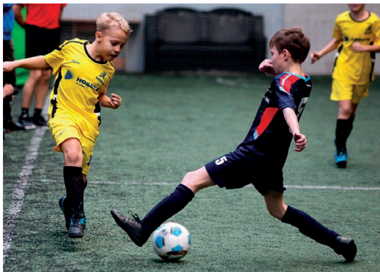
▲ Второй год подряд в младшей возрастной группе ребята из «Арго» одерживают победу в областном финале престижного турнира

Второй год подряд в самой младшей возрастной группе озерские мальчишки одерживают