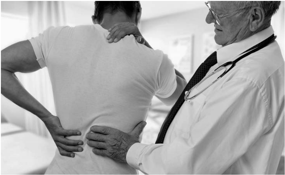
▲ Боль в спине – вторая после вирусных инфекций причина нетрудоспособности россиян

В информационном центре ПО «Маяк» в рамках проекта «Школа здоровья» прошло очередное занятие, на этот раз посвящённое болям в спине.