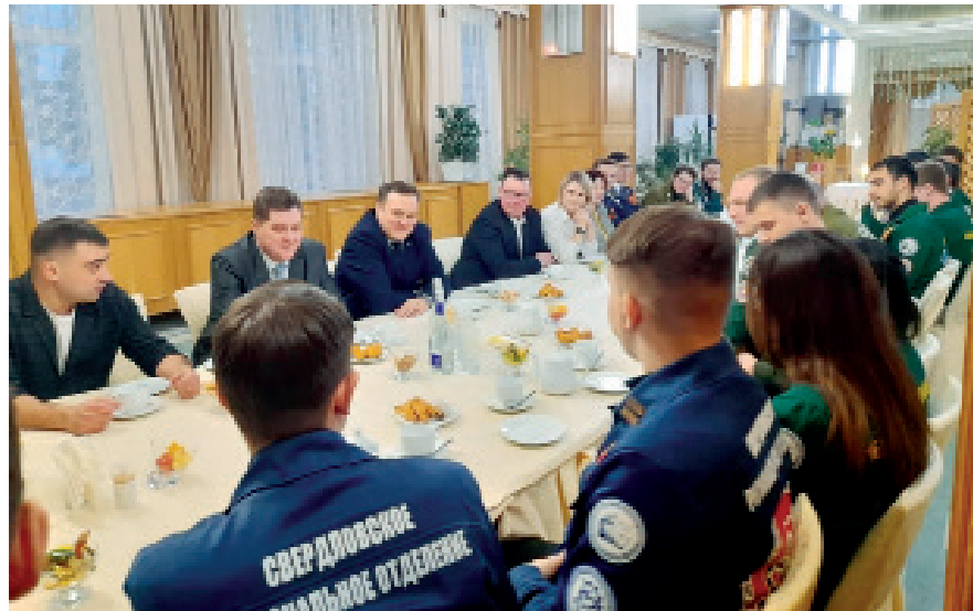
▲ Встречи командиров стройотрядов и руководителей «Маяка» – традиция

Строек в обозримом будущем, отметил руководитель предприятия, на «Маяке» будет много вплоть до 2060 года: «По сути, до этого времени мы должны заново отстроить комбинат». Соответственно, уже сегодня на предприятии ощущается потребность в строительных специальностях – как в рабочих, так и в ИТР-персонале. Это сварщики, мон-