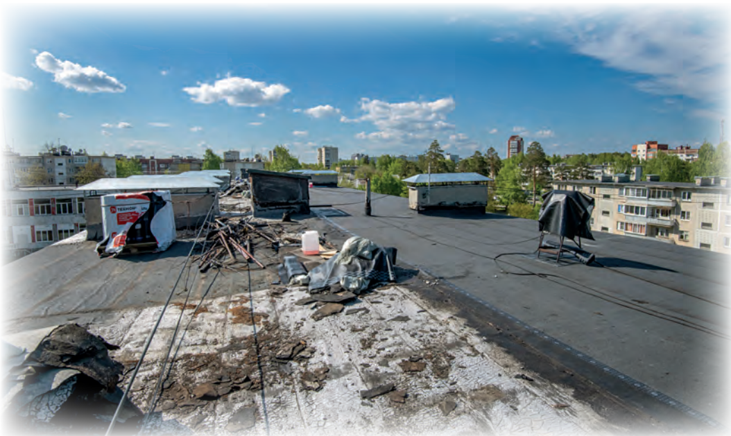
▲ Строительная компания, которая выполняет капитальный ремонт кровли дома №4 по улице Семёнова, уверяет: все работы выполняются по технологии, качество гарантируется

М ногоквартирные дома (МКД) по Семёнова, 14 и 4 были построены в 1972 году. С тех пор крыши на них ни разу капитально не ремонтировали. Текущие ремонты были – замазывали трещины, меняли самые обветшавшие участки кровли. Но до планового капитального ремонта было далеко: очередность капремонта определяет Региональный оператор капитального ремонта МКД Челябинской области, в фонд которого мы все ежемесячно, начиная с 2015 года, платим взносы.