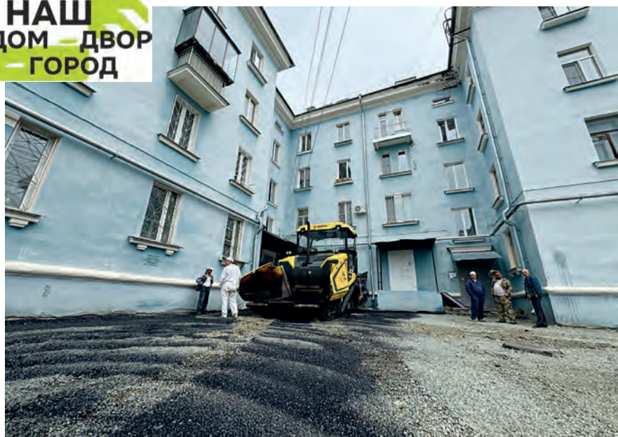
▲ За май и июнь уже благоустроены по пять дворовых территорий на Уральской и Космонавтов, а также два двора на проспекте Победы и улице Кирова