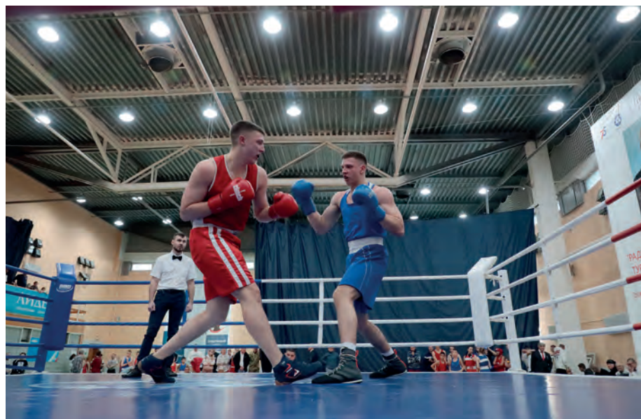
◀ И сегодня бокс – один из самых популярных видов спорта в Озерске