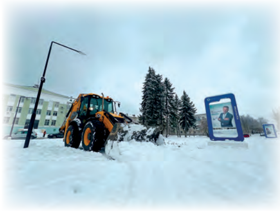
▲ Обильные осадки осложнили жизнь не только озерским автолюбителям, но и пешеходам

– В первую очередь проводится уборка на автомобильных дорогах с высокой интенсивностью движения. Здесь задействовано 20 единиц техники. Подрядчики работают в две смены. Проводится противогололедная обработка дорог, где существует опасность для пешеходов и автомобилей. Это спуски, подьёмы, крутые повороты, пешеходные переходы и автобусные остановки. Здесь используется песчано-солевая смесь. Что касается очистки тротуаров, то это полностью ручной труд. Сперва очищаются автобусные площадки, пешеходные переходы и заезды во дворы, – поясняет начальник управления капитального строительства и благоустройства администрации округа Надежда Белякова .