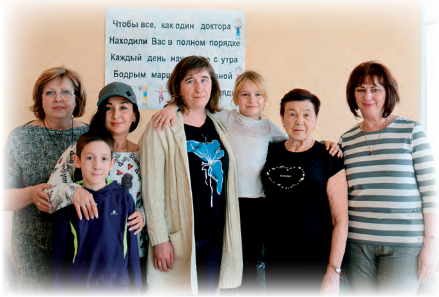
▲ Участники ЗОЖ-лектория

Для семей с детьми мобилизованных озерчан актив проекта «Женское движение «Единой России» организовал ЗОЖ-лекторий, приуроченный ко Всемирному дню здоровья – 7 апреля.