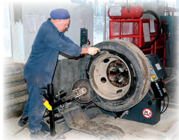
▲ Теперь время шиномонтажных работ составляет 1 час 15 минут

В 2023 году на «Маяке» реализовано 73 проекта Производственной системы Росатома (ПСР).