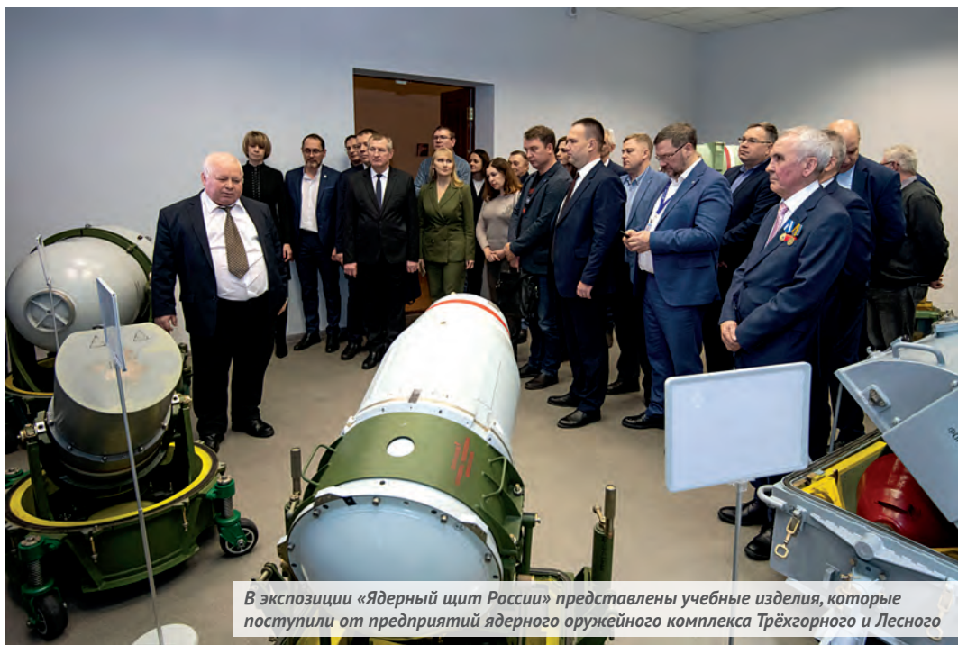
В экспозиции «Ядерный щит России» представлены учебные изделия, которые поступили от предприятий ядерного оружейного комплекса Трёхгорного и Лесного

В информационном центре ПО «Маяк» прошла торжественная церемония открытия новой музейной экспозиции «Ядерный щит России».