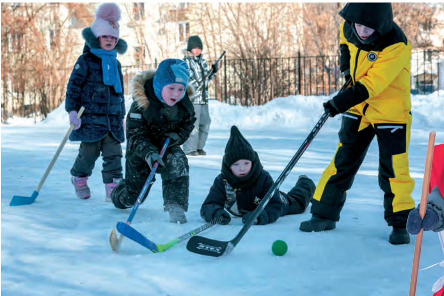
▲ Розовощёкая ребятня с азартом включилась в игру