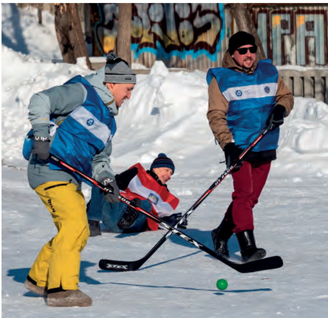
▲ На площадках скрестили клюшки друзья, соседи, сослуживцы...

команды: это жители домов на проспекте Ленина, улицах Герцена и Свердлова.