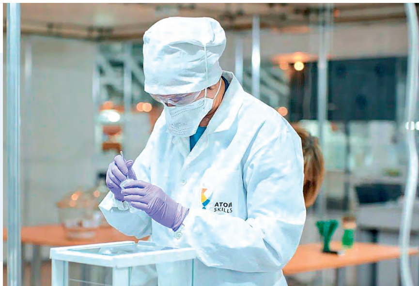
▲ Участие «Маяка» в чемпионатном движении дает толчок к развитию компетенций персонала и дальнейшему их масштабированию в реальном производстве

не накладывает запрет на развитие данной компетенции. При желании возможно создание новой сборной инициативных работников, не участвовавших ранее в чемпионате в данной компетенции и готовых представлять «Маяк» на отраслевом чемпионате AtomSkills в компетенции «Управление жизненным циклом».