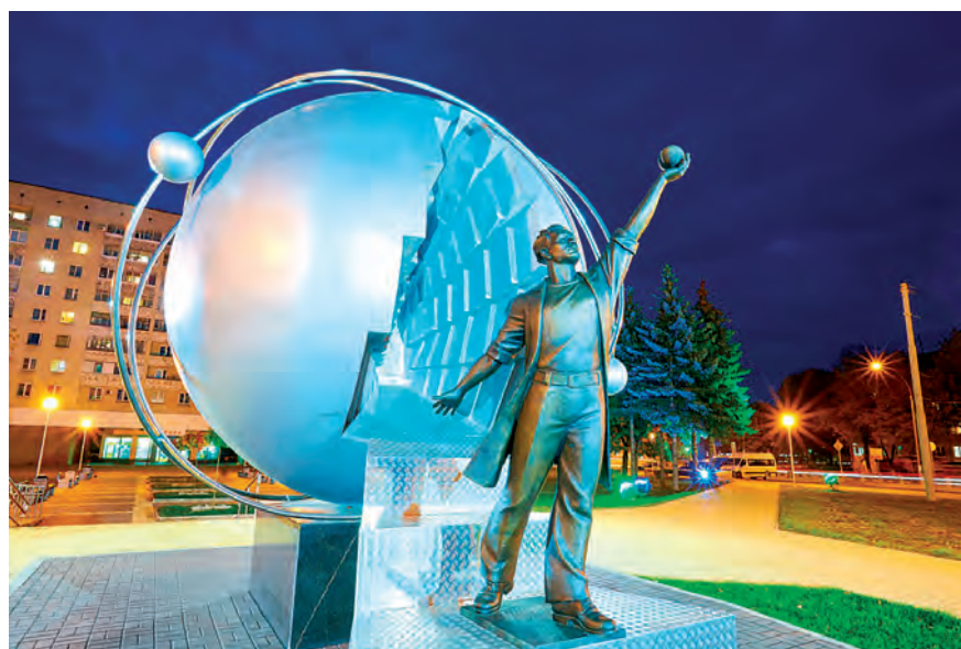
▲ Памятник первопроходцам атомной промышленности в Обнинске

Трогательную книгу написала заслуженный ветеран «Маяка» Га-