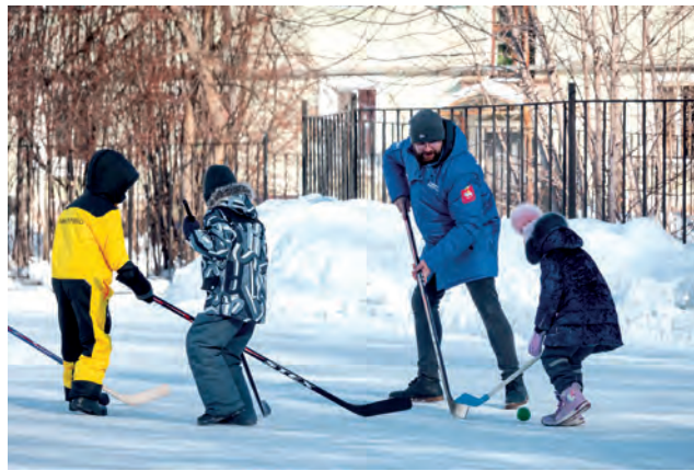
▲ В союзниках юных хоккеистов депутат Виталий Вельке