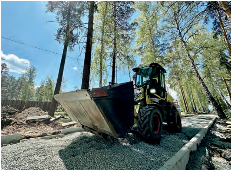
▲ 8906,5 кв.метров – общая площадь участка на аллее пр.Ленина, выделенного под благоустройство

– В настоящее время на пешеходной аллее по проспекту Ленина работу выполняют две организации, – отметил Александр Жмайло, – у каждой из них определены объёмы и сроки, контракты должны быть исполнены до осени 2024-го. На аллее заменят старое асфальтовое покрытие на брусчатку, цветом будет обозначена зона для велосипедов. Кроме того, установят новые скамьи и восстановят газоны. Все участки аллеи соединят дорожными