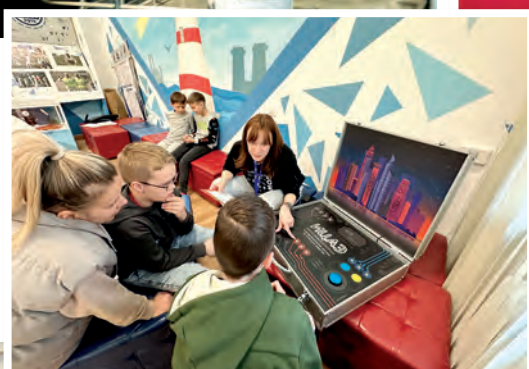
На научных лужайках ИЦАЭ всегда очень интересно