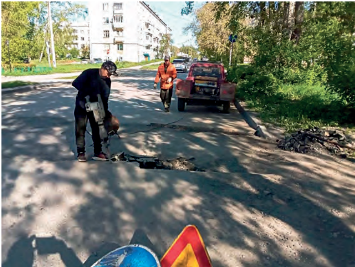
▲ На улице Космонавтов подрядчики ведут ямочный ремонт

«Хватит официальных переписок, нужен диалог напрямую»: руководители города и «Маяка» пригласили к разговору представителей управляющих и подрядных организаций, а также профильных специалистов администрации, ответственных за благоустройство округа, – проблемы есть, и их надо решать.