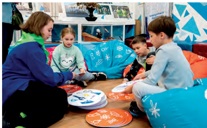
► На научных лужайках детвора не скучала

В новом свете на этот раз предстал и Дом-музей имени И.В. Курчатова, где активисты совета молодежи предприятия и студенты федерального проекта «Профессионалитет» дебютировали со спектаклем «Игорь Курчатов. Шах и мат», поставленным в формате непрофессиональной читки.