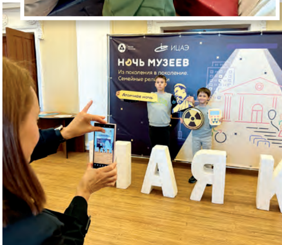
Экскурсии шли нон-стоп