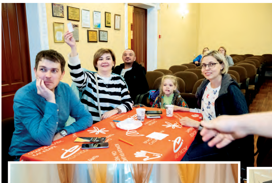
Команда «Букля» на адрена- линовом квизе ИЦАЭ