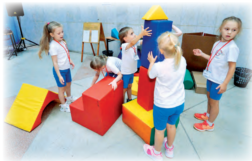
▲ В ДТДиМ развернулся настоящий космодром: детвора строила космические корабли и запускала их на планеты Солнечной системы