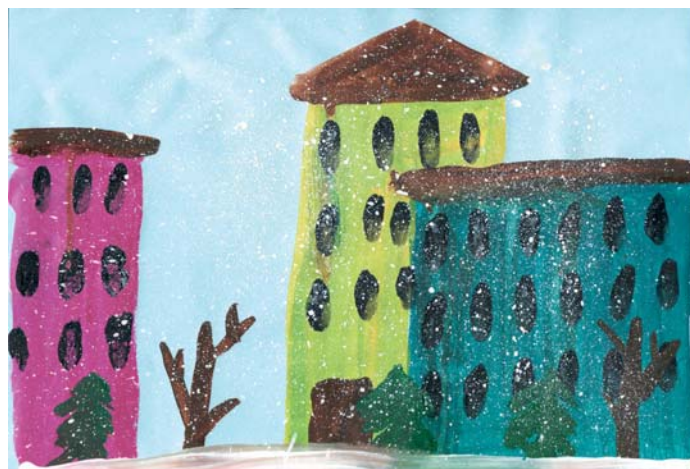
▲ Накануне Нового года дети нарисовали открытки для участников специальной военной операции