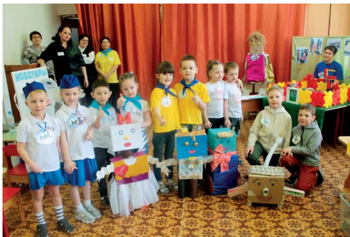
Для ребят из детских садов Озерска состоялся настоящий праздник технического творчества

28 января для ребят из детских садов Озерска состоялся настоящий праздник технического творчества.