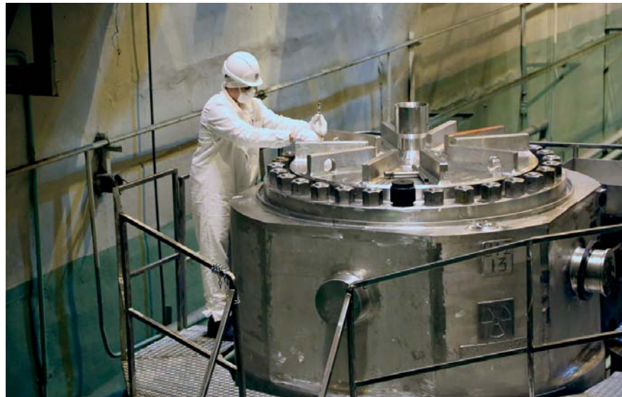
В 2023 году радиохимический завод продолжит выполнять задачи по переработке отработавшего ядерного топлива и выпуску готовой продукции

Во втором полугодии 2023 года ПО «Маяк» станет поставщиком сырья для нового реактора – БРЕСТ-300. Это будет быстрый реак-