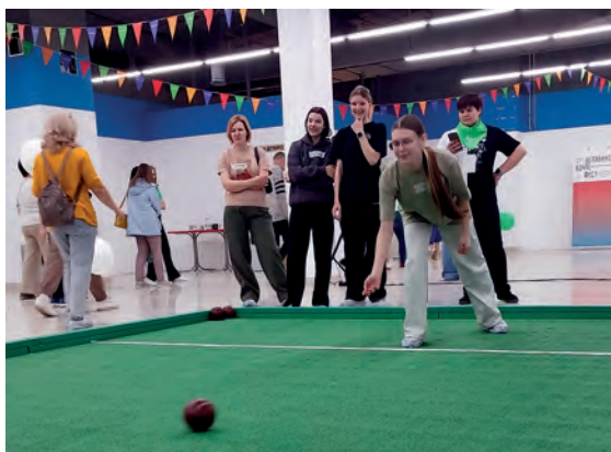
▲ На корте команда «Спортики»

Бочче – игра на выбывание. По механике – смесь боулинга и керлинга: спецплощадка (корт), прицельный заброс шаров и невероятный спортивный азарт. По итогу из 12 команд-участниц до финиша дошли три: игроки «Да!» взяли золото, «Стрекозы» – серебро, «Мирные» – бронзу.