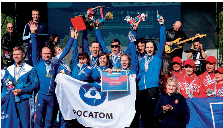
▲ Сборная Росатома возглавила пьедестал почета Всероссийского фестиваля ГТО

Команда Росатома с участием «маяковцев» стала победителем Всероссийского фестиваля ГТО.