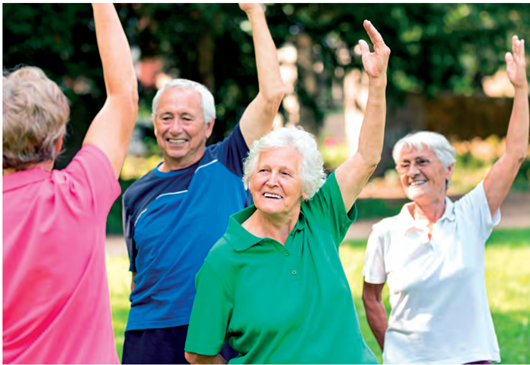
▲ Активные люди редко болеют болезнью Альцгеймера