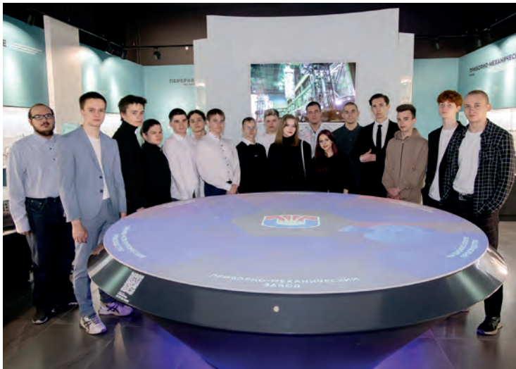
▲ Призеры конкурса «PRO.пуск-2024»

В информационном центре ПО «Маяк» прошло награждение победителей конкурса проектных работ озерских школьников и студентов «PRO.пуск».