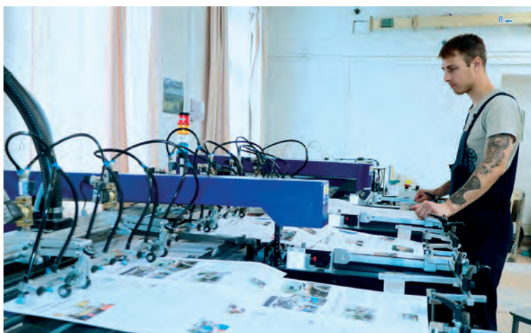
Со вторника по пятницу типография «Маяка» работает круглосуточно, чтобы горожане могли получить газету «Вестник Маяка» вовремя

2017 год — пуск 4-цветной офсетной печатной машины, издание газеты «Вестник Маяка» на новом оборудовании.