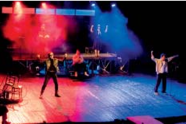
▲ Сцена из эскиза спектакля «Мой папа Питер Пэн»

Большой детский фестиваль (БДФ) проводится с 2018 года, он организован в рамках федерального проекта «Культура малой Родины» и проводится при поддержке Министерства культуры РФ. Его организаторы – Фонд поддержки и развития социокультурных проектов Сергея Безрукова и Московский Губернский театр.