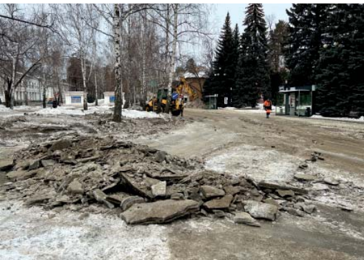
▲ После коммунальной аварии на проспекте Ленина наледь в районе площади Курчатова засыпали слоем черно-серой массы

Остаются вопросы и по уборке улиц. Снегопадов не было уже месяц, а кучи снега местами не вывезли до сих пор. Больше всего озерчан возмутили горы серого снега на «Бродвее». Завалы там красуются прямо по