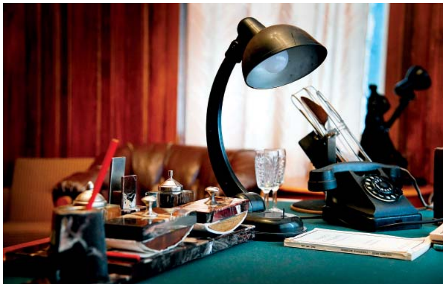
▲ Один из молчаливых очевидцев истории – телефон на рабочем столе Курчатова

Между тем в Доме-музее Курчатова на его рабочем столе таких телефонов даже ни один, ни два, а целых четыре! Один без диска – «для прямой связи со Сталиным и Берией», как шутят экскурсоводы (в действительности с пультом управления «Аннушки»). Каждый телефон под два кило весом. Солидные, изготовленные из черного карболита аппараты подчеркивают дух эпохи и, поговаривают, представляют коллекционный интерес. Молчаливые очевидцы истории – остается только догадываться, свидетелями каких