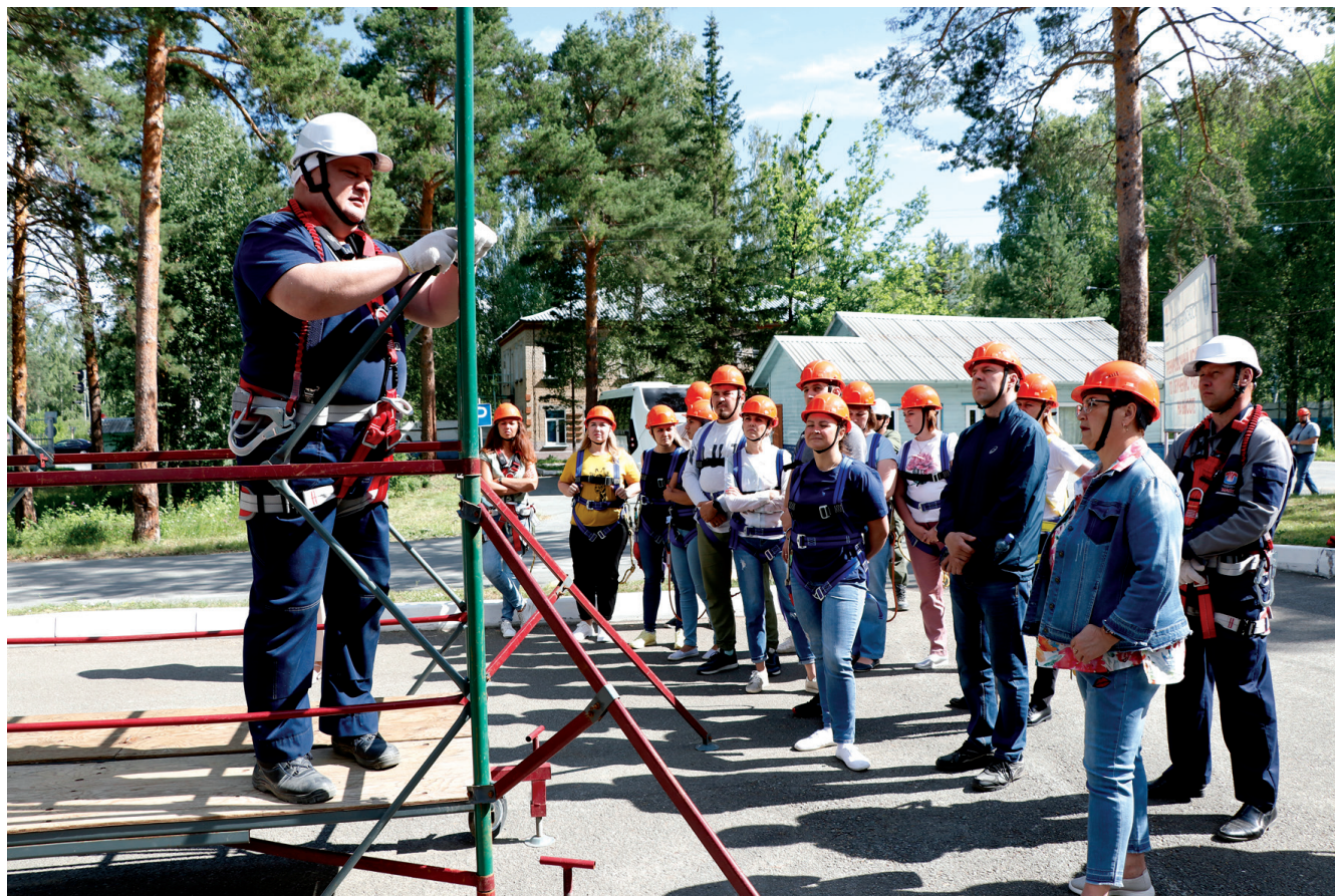
Учебно-тренировочный полигон на территории ремонтно-строительного управления по отработке практических навыков работы на высоте

На «Маяке» стали постоянными выездные совещания совета по культуре безопасного поведения, которые проводятся в подразделениях предприятия. Один из важных инструментов по профилактике производственного травматизма, с помощью которого можно развивать культуру открытости и дове-